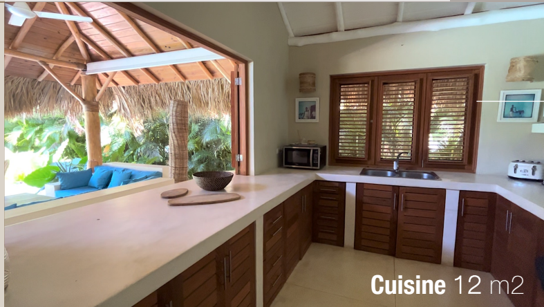
Cuisine 12 m 2