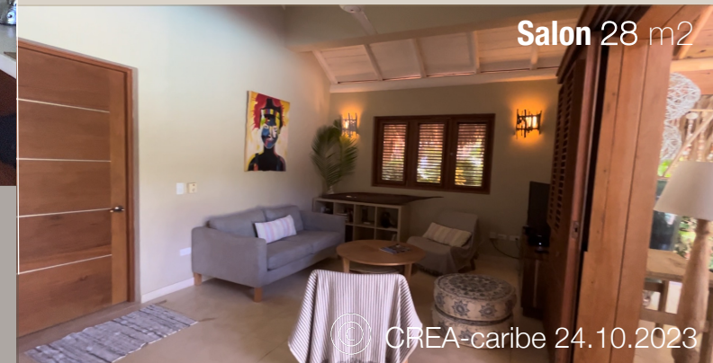
Salon 28 m 2