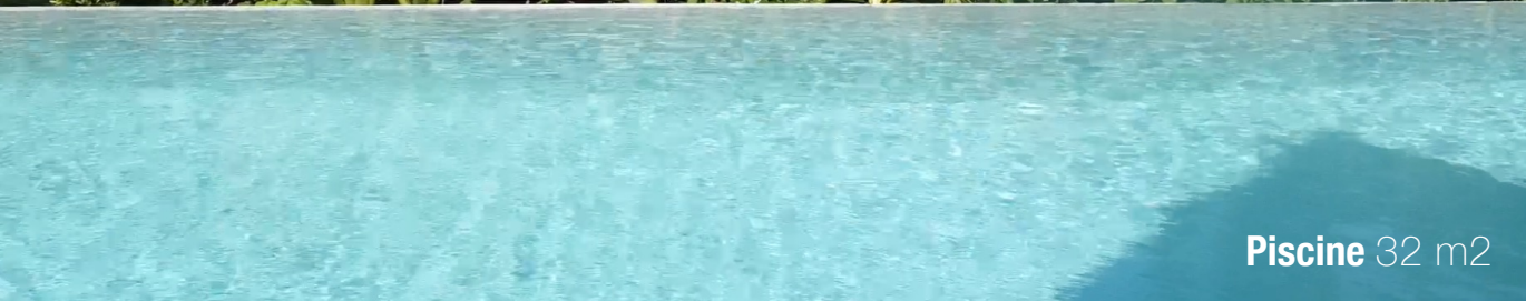
Piscine 32 m2