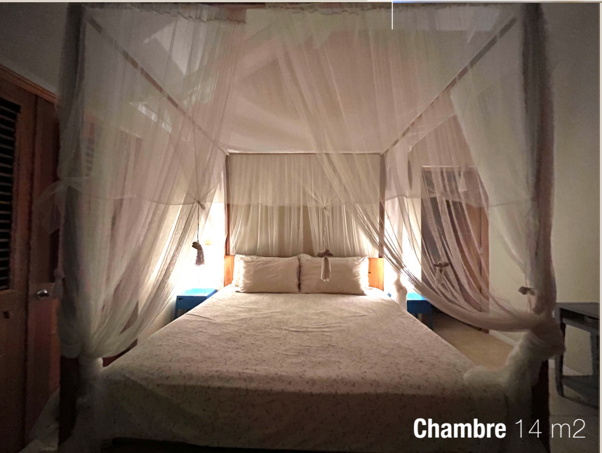
Chambre 14 m 2