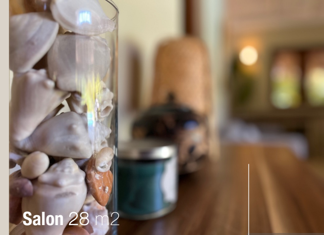
Salon 28 m 2