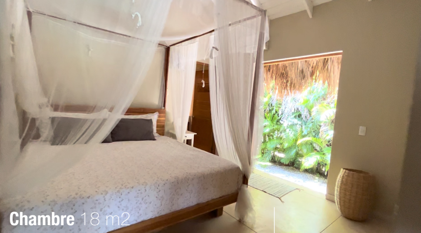
Chambre 18 m 2