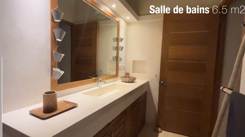
Salle de bains 6.5 m 2